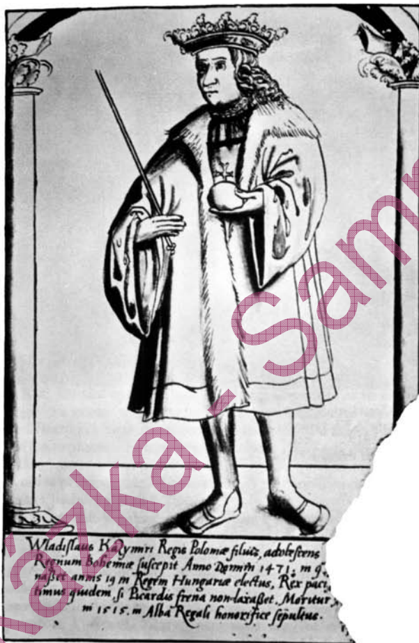
Kresba VLADISLAVA JAGELONSKÉHO s královskými insigniemi. Reprodukce z tzv. Házmburského kodexu.